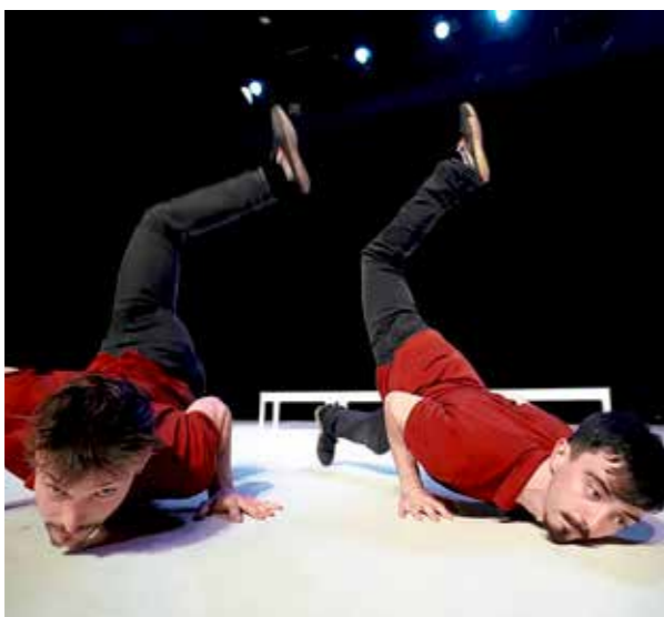
KORZO - DANCZICK 23

Het jaar 2021 was kort; vier maanden slechts lieten de richtlijnen van het RIVM toe dat wij ons publiek konden ontvangen. De eerste zes maanden was het stil in het gebouw; daarna kwam het leven, met horten en stoten, langzaam terug. Als corona een ding duidelijk heeft gemaakt, dan dit: de gelijktijdige, fysieke aanwezigheid van kunst, kunstenaar en toeschouwer is onontbeerlijk voor een kunstencentrum als Corrosia, waar ontmoeting en cultuur in nauwe verbinding met elkaar staan. Digitale of virtuele oplossingen, hoe welkom ook, bieden slechts een noodverband. Kunst presenteren is werk van en voor mensen van vlees en bloed. Uiteraard hebben we alle richtlijnen trouw gevolgd en de regelmatig bijgewerkte adviezen van de VSCD/VVP toegepast, waarbij we hebben ondervonden hoe waardevol het is aangesloten te zijn bij een branchevereniging die actief onderhandelt en in gesprek is bij de landelijke overheden.