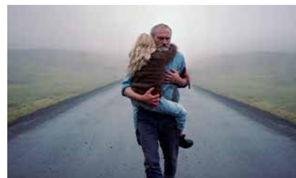
A WHITE, WHITE DAY

Editie 2021 van TEAM FRANC was helaas de laatste die werd samengesteld onder aanvoering van onze voormalige burgemeester Franc Weerwind. Mede dankzij zijn enthousiasmerende betrokkenheid kon TEAM FRANC uitgroeien tot een jaarlijks terugkerend hoogtepunt van Corrosia Expo en een pareltje in onze environmentalist programming .