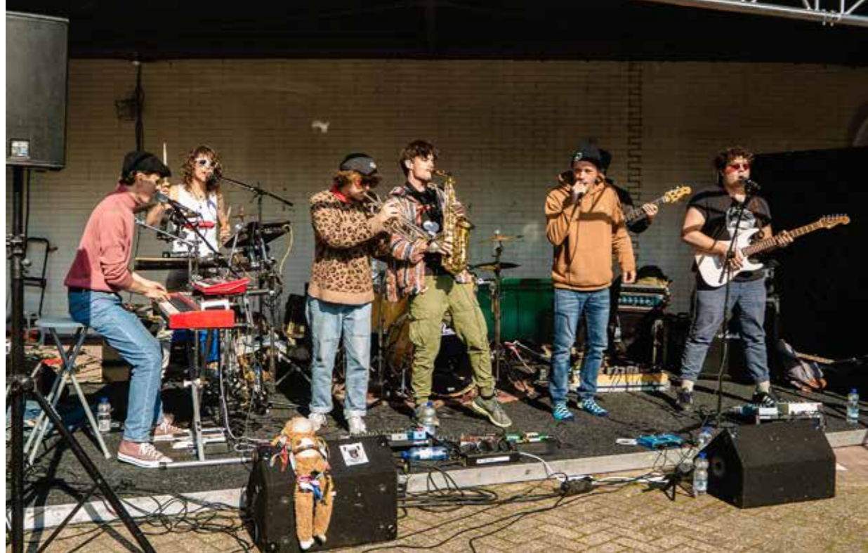
CIRCUS CORROSLIA