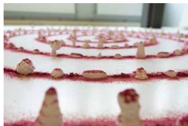
NARRATIVES OF NATURE - FOTO: MELISSA DUIJN

weer volgens het beproefde recept van begeleid expositiebezoek en discussiebijeenkomsten door een groep Almeerders samengesteld, grotendeels live tijdens de lockdownvrije zomer.