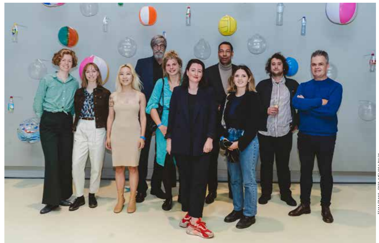
TEAM FRANC