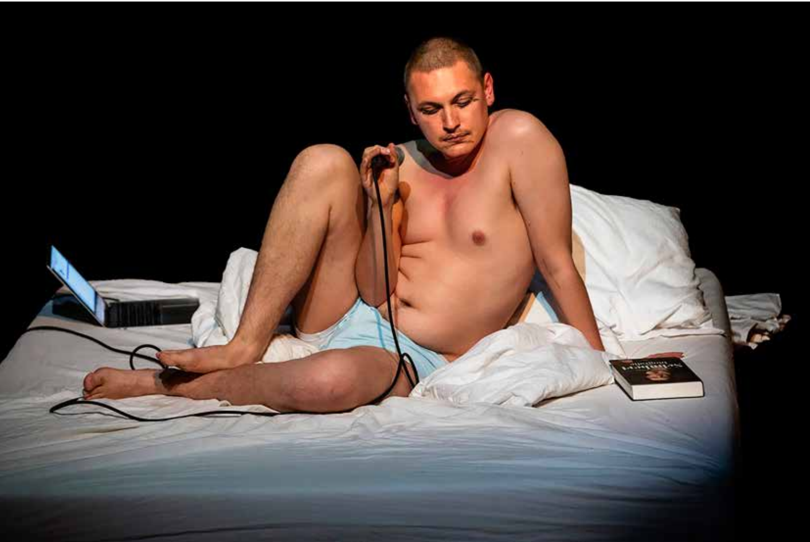
LOUIS JANSSENS/DESNOR - SERENADE

Lichtpunten in een lastig jaar - Jaarverslag 2021 is een uitgave van Corrosia Theater, Expo & Film in Almere.