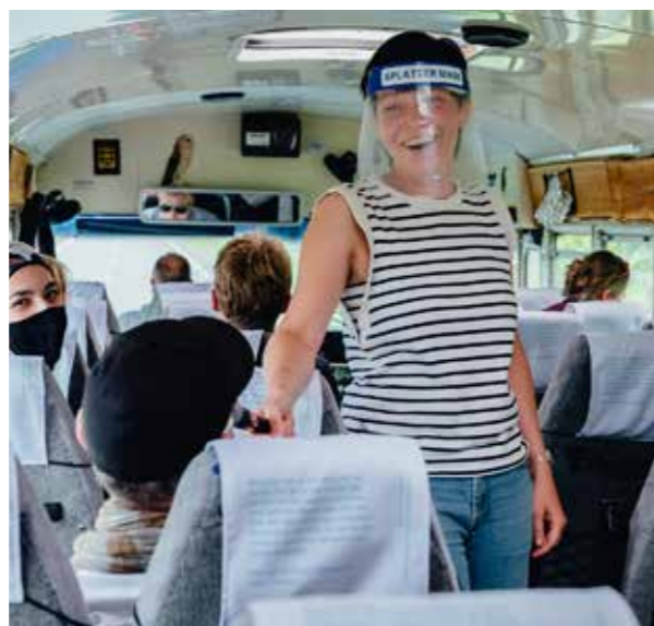
ENTER-ALMERE HAVEN

Kunst is voor velen een ver-van-mijn-bed-show. Zélf maken en zélf spelen kan die afstand verkleinen en liefde en enthousiasme kweken. Het is een van de manieren waarop wij Almeeders betrekken bij onze activiteiten. Helaas is dit onderdeel, met uitzondering van ENTER Almere Haven, van het publiekswerk in 2021 grotendeels komen te vervallen.