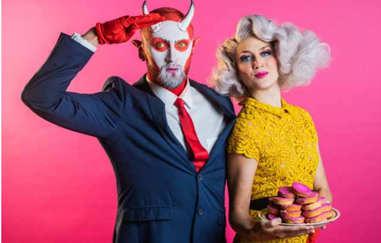
TEDDY'S LAST RIDE - SAFE SEX - THE MOVIE (CAMPAGNEBEELD)