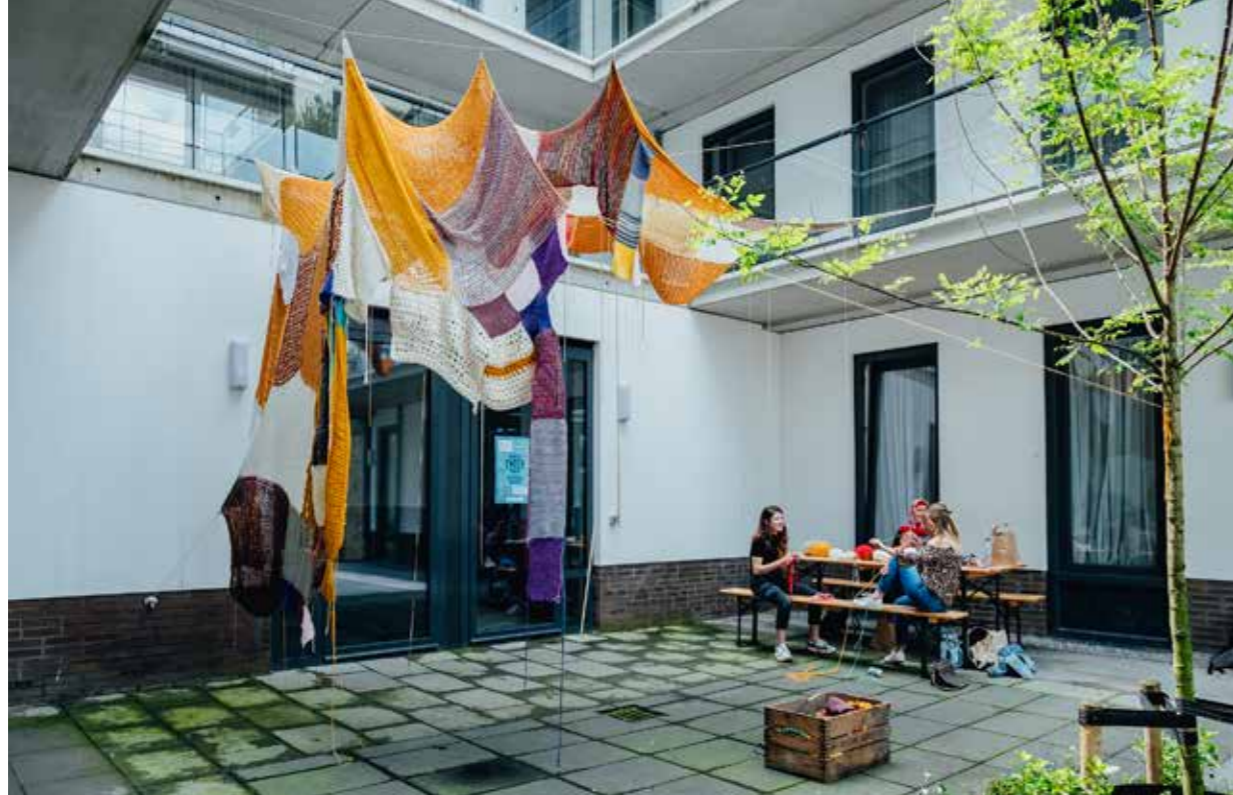
ENTER ALMERE HAVEN