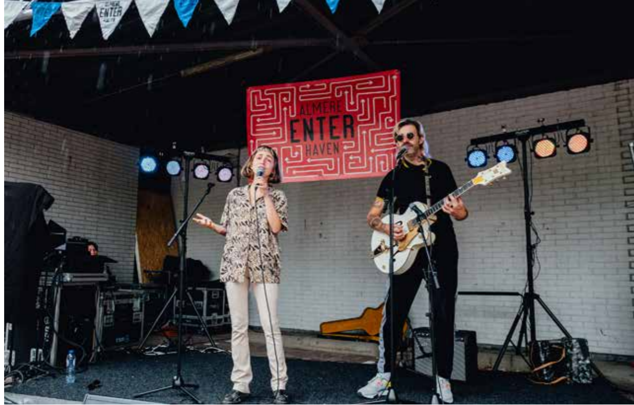
ENTER-ALMERE HAVEN