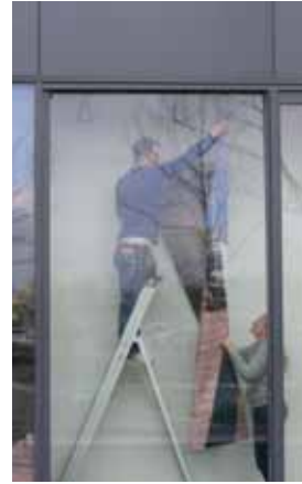
Locatieproject Corrosia in de etalage