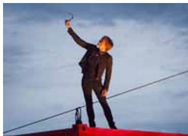
Voorstelling Dutch Vinex Wonder Boys - BonteHond - beeld Saris & den Engelsman