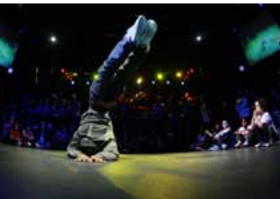
Danswedstrijd Spin Off 2012