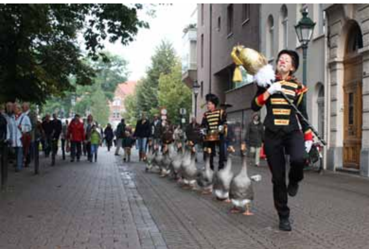
Sinterklaasintocht 2012 - De ganzenfanfare