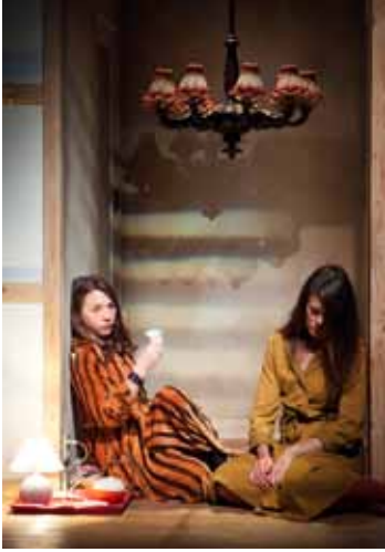
Voorstelling Am Ziel - Toneelschuurproducties - beeld Annegien van Doorn