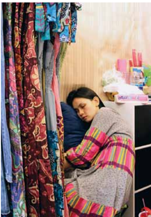
Expositie Lelystad slaapt - Sleeping City - beeld Marieke Breed