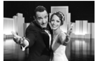
Film The artist