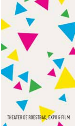
Brochure, ontwerp Herman van Bostelen