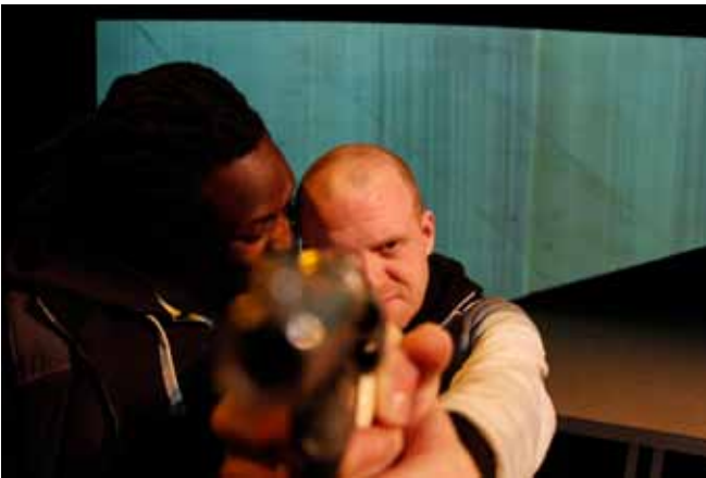
Voorstelling Hate - Likeminds i.s.m. Teunkie van der Sluis