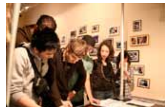
Film Festival Jong - Workshop aan de animatietafel