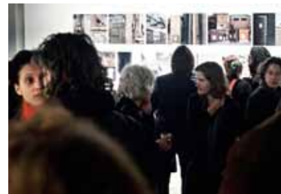
Opening expositie Who's afraid of