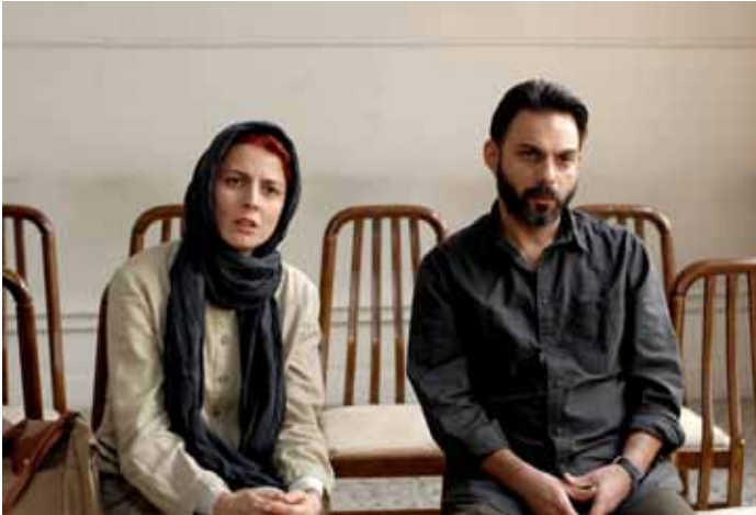
Film A Separation