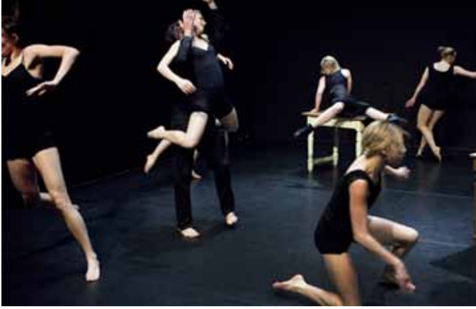
Voorstelling Seule - Nieuw West i.s.m. Truus Bronkhorst - beeld Leo van Velzen