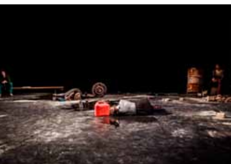
Voorstelling Benzine - HKU i.s.m. Oliver Provilg