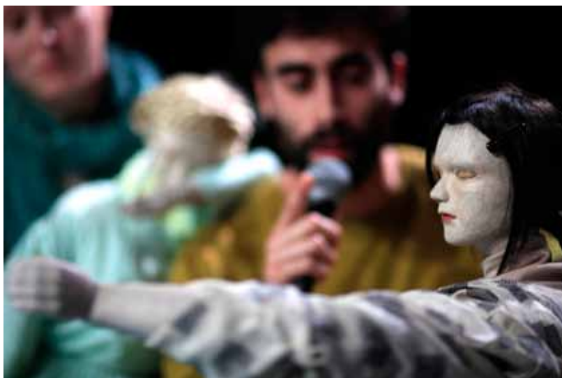
Voorstelling Antigone - Nicole Beutler i.s.m. Ulrike Quade