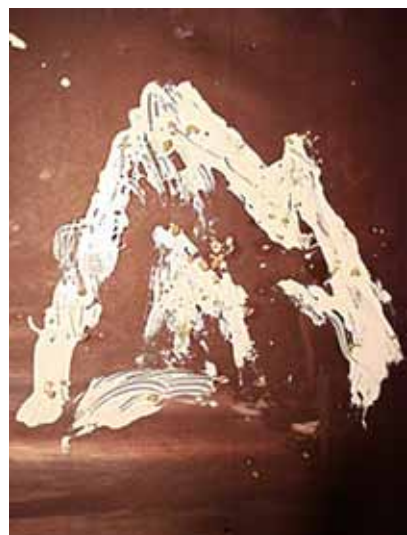
Voorstelling Berg - Cie sQueezz

Deze inventarisatie is begin 2013 gepresenteerd. Met voldoende zelfstandige expositieruimte, een bescheiden aanpassing aan de theaterzaal, een eigentijds café en de toezegging dat het de aankleding en dus de sfeer mag bepalen, lijkt er een gebouw te komen waarin Corrosia zijn toekomstplannen kan realiseren. Inmiddels wordt er gewerkt aan een concreet beheerplan. Het streven is om de verbouwing begin 2014 van start te laten gaan en om begin 2015 te heropenen. Op het moment van dit schrijven is nog niet duidelijk wanneer Corrosia precies moet vertrekken en vanuit welke locatie het kunstencentrum tijdens de verbouwing zal opereren.