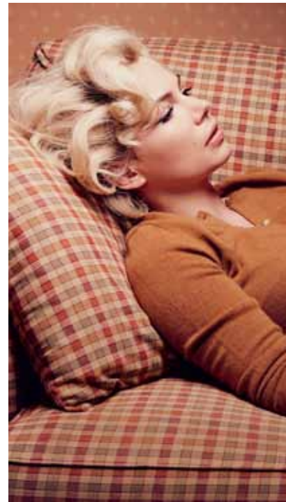
Film My week with Marilyn