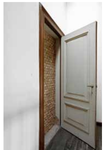
Expositie Who's afraid of - Paranoid Obstructions - beeld Els Vanden Meersch